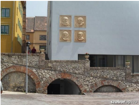
A könyvtárat díszítő domborművek a pécsi Zsolnay Kulturális Negyedben

A Germanisztikai Intézet Könyvtára a Múzeum krt. 6-8. szám alatti épület beépített udvarában található az Angol-Amerikai Intézet Könyvtárával egy helyiségben. Az épület 1881 és 1883 között épült Steindl Imre tervei alapján historizáló neoreneszánsz stílusban az akkori Magyar Királyi József Műegyetem számára. A külső és belső homlokzat díszítőelemei a pécsi Zsolnay-gyár munkái. A korábban nyitott belső udvart 2006-ban a műemléki követelmények figyelembevételével építették be könyvtári célra. A két önálló intézeti könyvtár 2007 óta működik ezen az impozáns helyen.