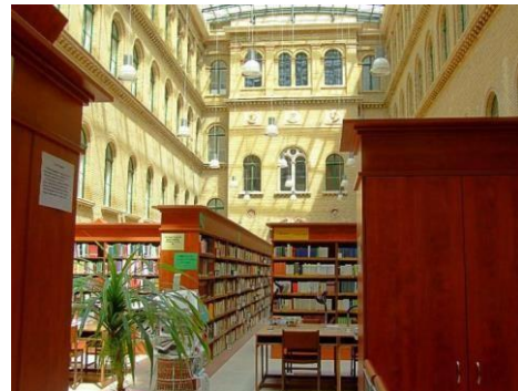
A könyvtári olvasóterem